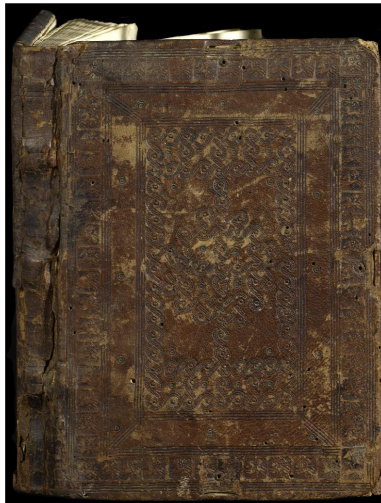
Milano, Archivio Storico Civico e Biblioteca Trivulziana, Cod. Triv. 796 (piatto anteriore)